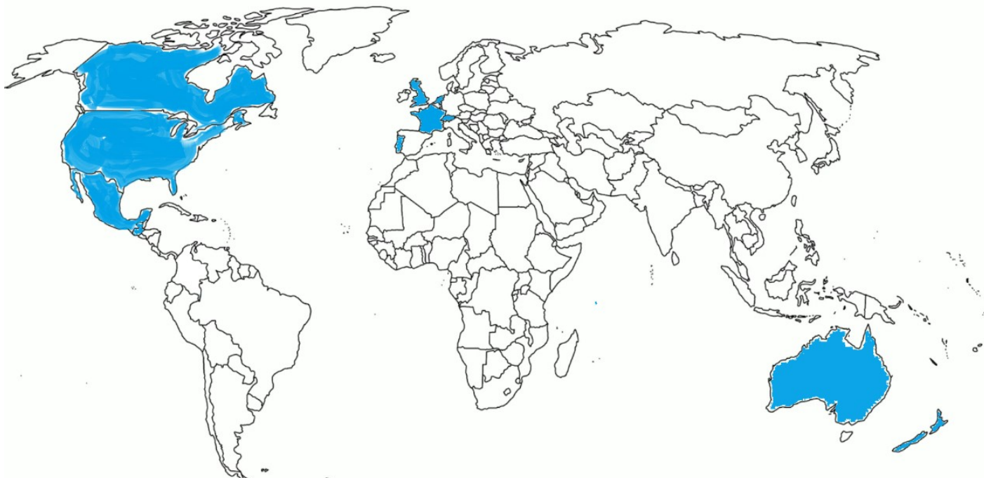
Figura 2 - Mapa mundo demonstrando quais países* apresentam enfermagem de reabilitação como especialidade.