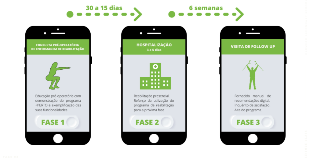
Figura 1 – Fases do +PERTO

Esta aplicação permite em on-time, através de indicadores de ação, acompanhar o desempenho e receber feedback à medida que a aplicação é usada pelos participantes através das suas respostas a questionários e formulários. Está criado um alerta em caso do utente apresentar dor “catastrófica” que permite conhecer o que despoletou a dor e atuar no seu controlo. Os utentes são elucidados a identificar sinais e sintomas de alerta para saberem quando devem procurar ajuda diferenciada. Permitindo que estes controlem melhor a dor, o edema, e ferida cirúrgica; serão mais capazes de participar ativamente e com proveito no programa de exercícios de reabilitação estipulado e aumentar a sua capacidade para o autocuidado, permitindo uma eficaz preparação e efetivo conhecimento pré-operatório, alcançando os melhores resultados de recuperação possíveis.